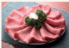
①能登牛(すきやき肉)

能登牛認定店で能登牛を 飲食・購入 してくださった方の中から 能登牛をはじめとした百万石の極み食材が 抽選で40名様 に当たる! (応援メッセージでさらに10名様)