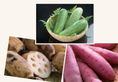
④季節の認定品目ステーク加賀野菜3種つめあわせ