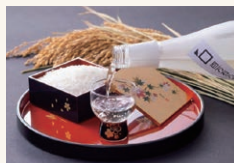
②百万石乃白を使った地酒